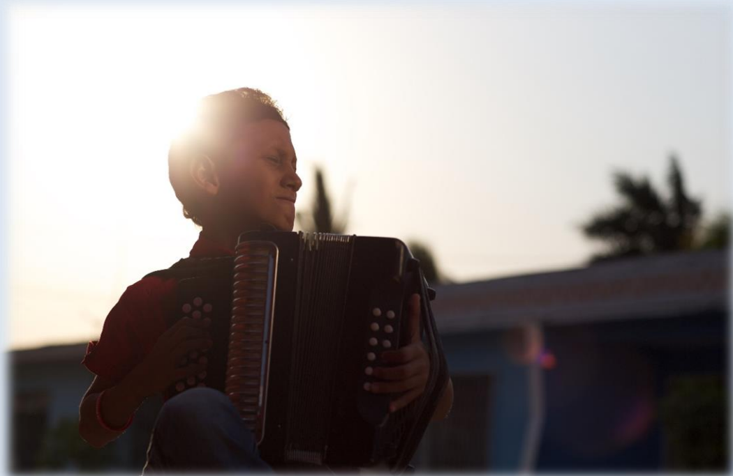
📍 'Melodías en Turbaco'. Un niño acordeonero ensaya las notas musicales antes de un concierto.